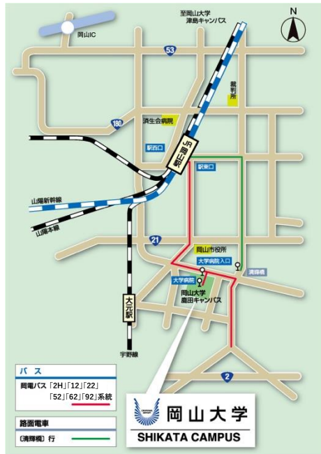
<岡山大学 鹿田キャンパス構内図>